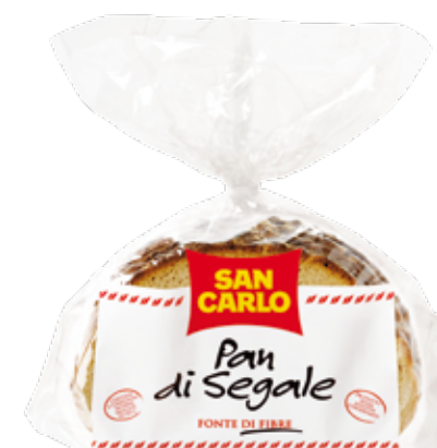
Pan di Segale