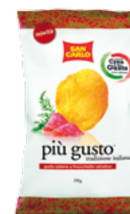
Più Gusto Salame e Finocchietto