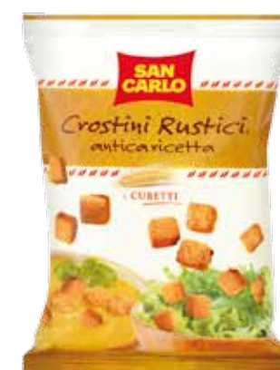
Crostini Rustici Antica Ricetta