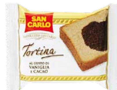
Tortina Vaniglia e Cacao