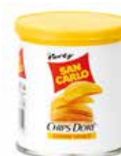
Chips Doré Vivace