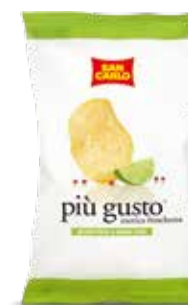
Più Gusto Lime e Pepe rosa