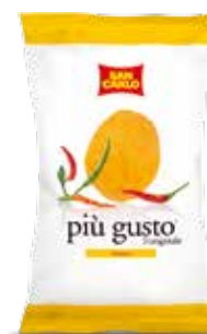
Più Gusto Vivace