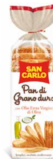
Pan di Grano Duro