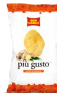
Più Gusto Cuore di Zenzero