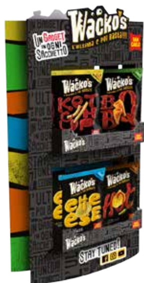
Espositore da banco

Per scoprire tutte le novità vai al sito www.wackos.it oppure sulla pagina Facebook o il profilo Instagram.