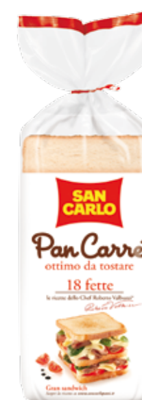
Pan Carré 18 fette