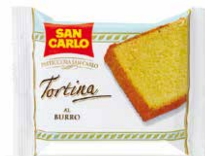
Tortina al Burro