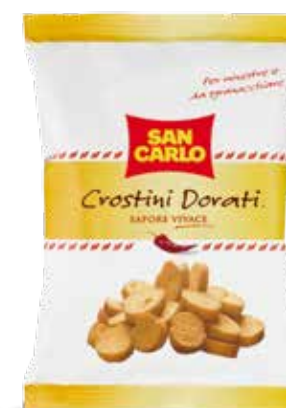
Crostini Dorati Sapore Vivace