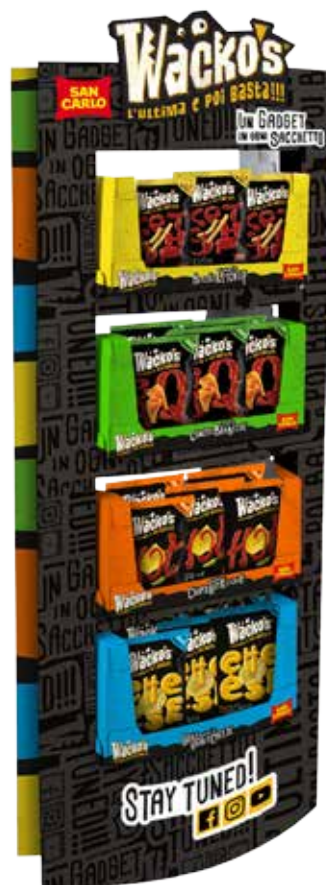
Espositore da terra