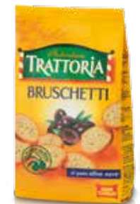
Bruschetti Autentica Trattoria