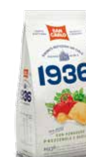
1936 Antica Ricetta