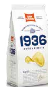
1936 Antica Ricetta