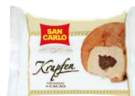
Tortina al Burro