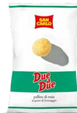
Due a Due