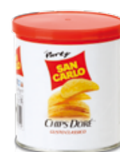
Chips Doré Classico