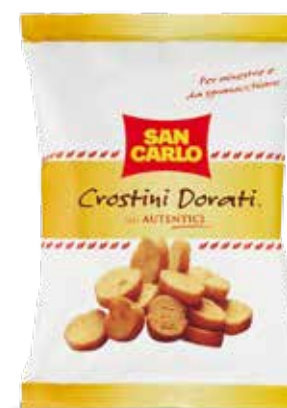
Crostini Dorati Gli Autentici