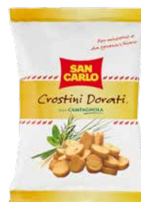
Crostini Dorati Alla Campagnola