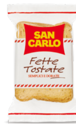
Fette Tostate Hotel