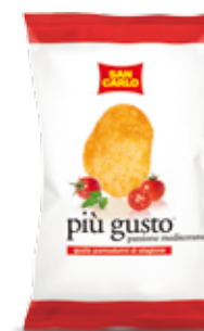
Più Gusto Pomodorini di stagione