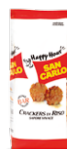
Crackers di Riso