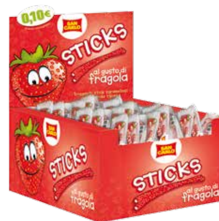
Sticks gusto Fragola