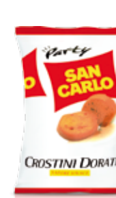
Crostini Dorati Vivace