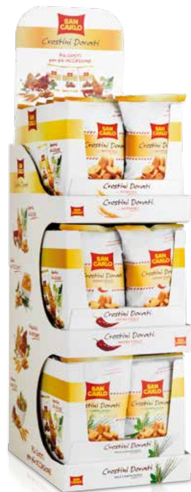
Espositore da banco