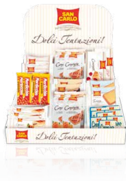
Espositore da banco

Ed infine, il tradizionale Mordicchio che dà gusto ed energia ai momenti di pausa.