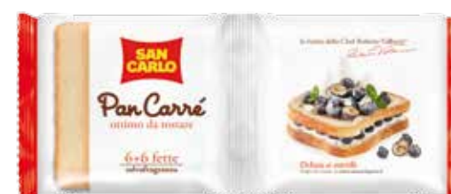
Pan Carré 6x6 fette