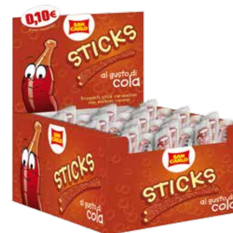
Sticks gusto Cola