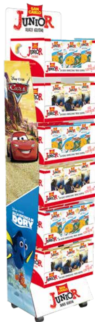
Espositore da terra