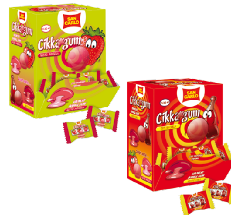
Cikka Gum gusto Fragola e Cola

Espositore da banco Caramelia, Cikka Gum, Frizzy Roll